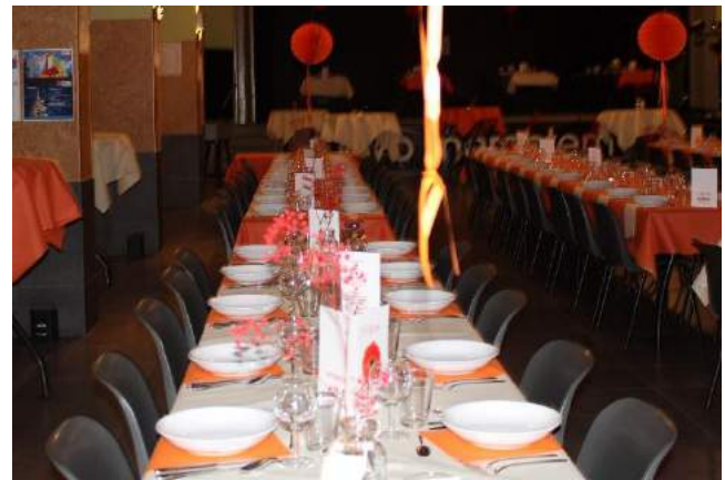
Mooie- tafel en zaalversiering.