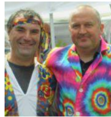
Tot zondagochtend met kermis , de twee ajoingazten