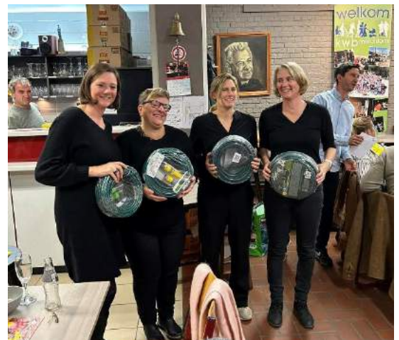
De nichtekekes behaalden de 1 ste plaats 😊