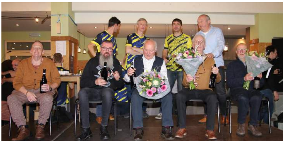
De gevierde KWB leden werden in de bloemetjes gezet en een goede fles wijn hoorde daar natuurlijk bij.